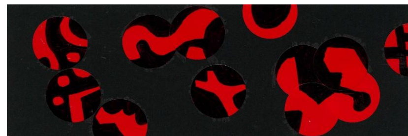
No.18 「赤丸シール変幻自在」