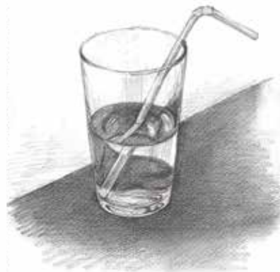
⑤水の入った ガラスコップ