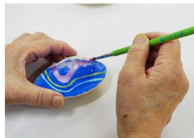
ハマグリのおおきさは約8～9cm

本格的な春の訪れが待ち遠しいこの季節。金、銀、パールなどの華やかな絵の具で、ハマグリにあなただけの“春”を表現しましょう。ハマグリは元々同じ貝でないと二枚の貝殻が組み合わせられないことから縁起物とされています。珍しい素材を使ったこの時期限定のワークショップ、ぜひご参加ください。