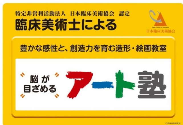
① スタンダード タイプ