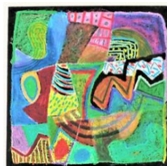
No.27 パッチワークあそび

《持参画材》 脳いきりオイルパステル・割り箸ペン・はさみ・鉛筆 スティックのり・新聞紙・ウェットティッシュ・ティッシュ 日本臨床美術協会会員証・単位集積記録表(コピー)