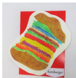
No.25 マイマイハンバーガー