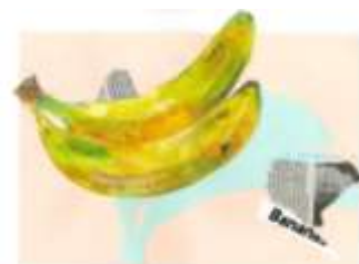
⑳ ツルっと コスって 描くバナナ