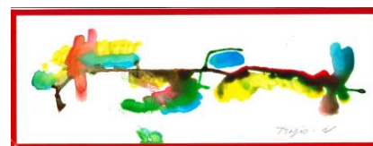
No.2 ゆらぎドリッピング