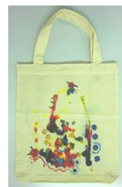
No.4 ホップステップリズム絵